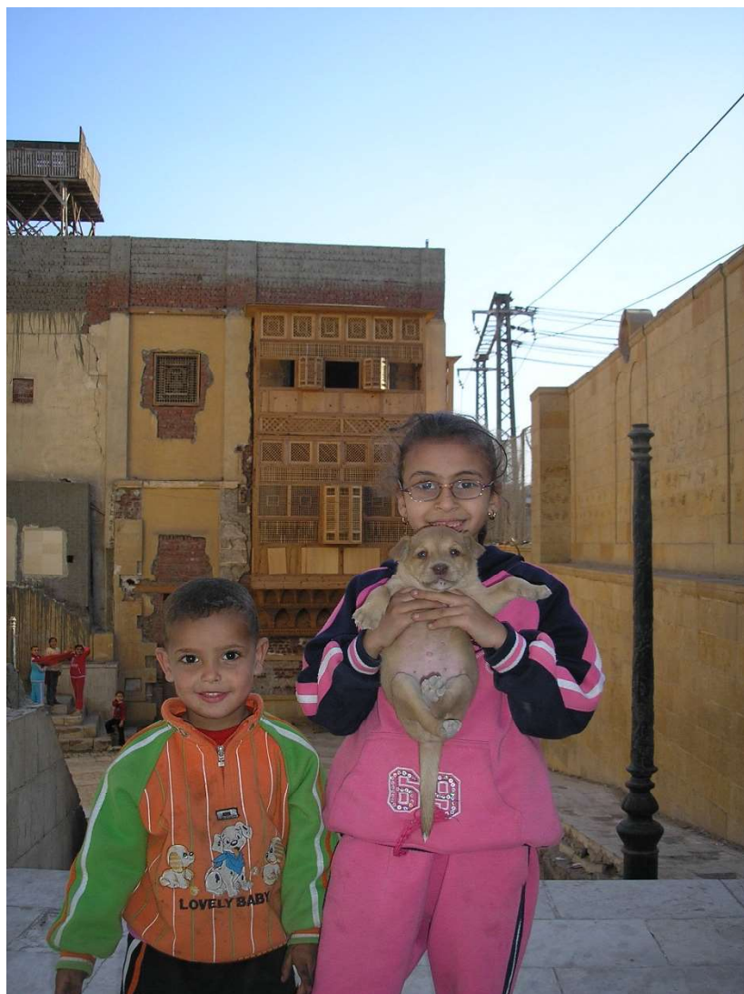
Рис. 4. Современные жители Египта – копты. Старый Каир.

Все гностики без исключения говорят о «семени высшей природы», которое оплодотворяет способных принять его избранных. Подобно семени, упавшему в плодородную почву, гносис развивается в душе и приносит