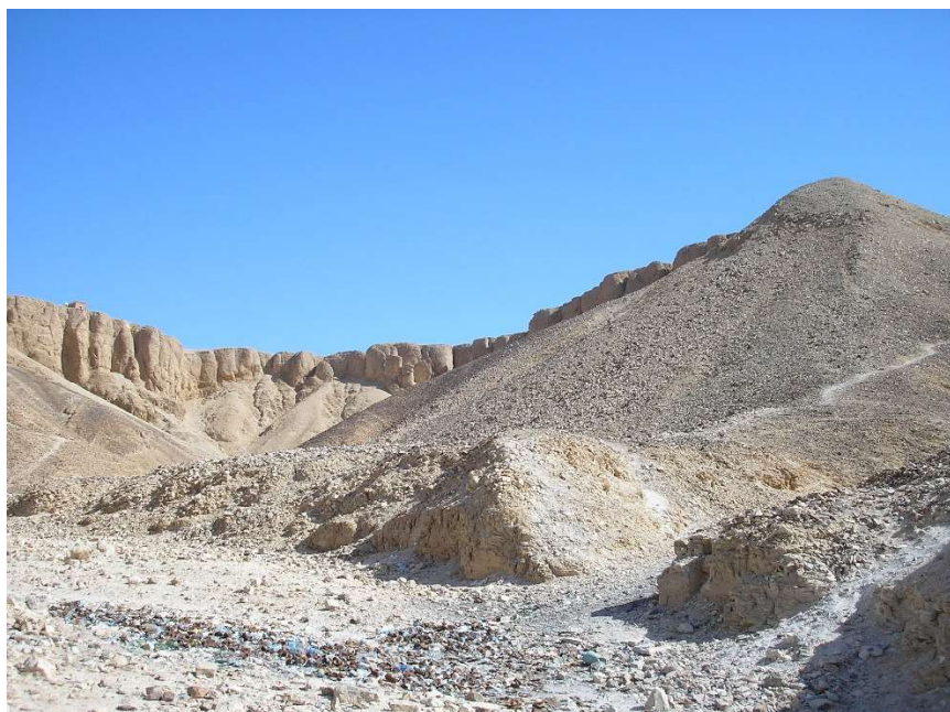
Рис. 1. В 1945 г. в Наг Хаммади, пустынном районе Верхнего Египта, была случайно обнаружена Коптская гностическая библиотека, пролежавшая в тайнике в пещере по крайней мере 16 веков.

Эти базовые идеи раскрываются в гностической литературе самыми разнообразными, нередко довольно экзотическими средствами, однако ясно, что практически для всех дошедших до нас текстов характерно четкое противопоставление материального и духовного, между которыми иногда помещается душевное, что является, вероятно, платоническим влиянием. Духовное совершенно, материальное дефектно и возникло в результате ошибки. Поэтому человек чувствует себя в этом мире неуютно и не на месте. «Странник я в этом мире», – говорит александрийский учитель гносиса начала II века Василид.