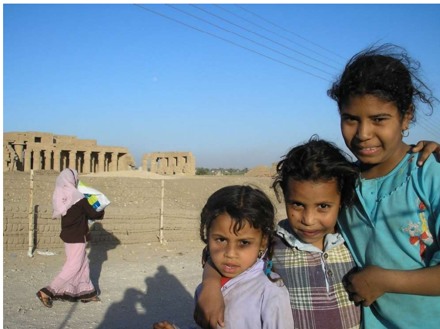
Рис. 3. Современные жители Египта – копты. Деревня близ Луксора (на заднем плане – Храм Рамзеса II).

Но и мир по отношению к человеку также настроен враждебно. Судьба и ее слуги (планеты и знаки зодиака), а также законы и социальное неравенство, установленные сильными мира сего, связали человека и лишили его самого главного – знания самого себя. Будучи от начала совершенным и бессмертным, человек погрузился в мир и забыл свою истинную природу. «Вспомни, что ты сын Царя», – говорится в коптском гностическом «Евангелии Фомы» (110). Пробуждение и прозрение – это то, что приносит гносис тому, кто в силах принять его в себя.