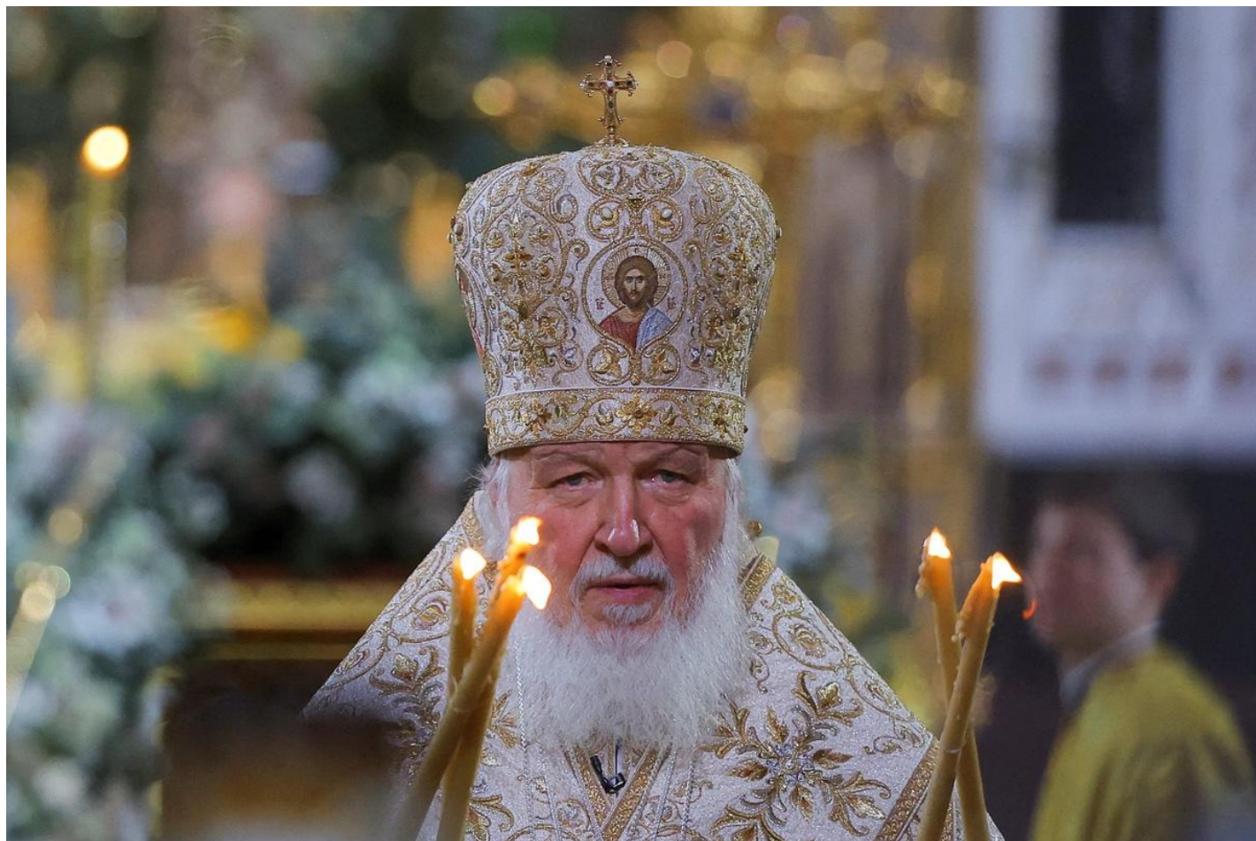
Патриарх Кирилл.

согласию с тем, что происходит сегодня, что вещается от имени церкви сегодня.