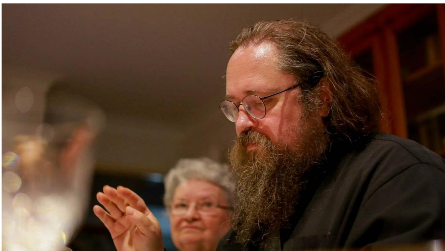
Андрей Кураев.

Патриарх Кирилл лишил священного сана дьякона Андрея Кураева